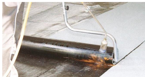
Variantsní natavování rozbalovačem rolí