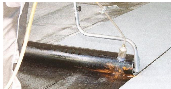
Variantské natavování rozbalovačem rolí