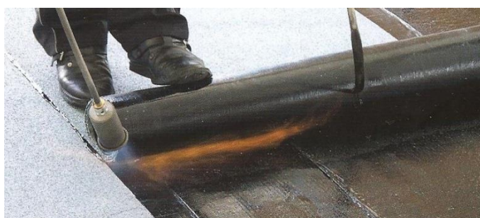
Natavování s navíječem rolí rozbalovačem rolí