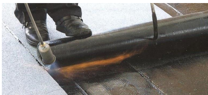
Natavování s navíječem rolí