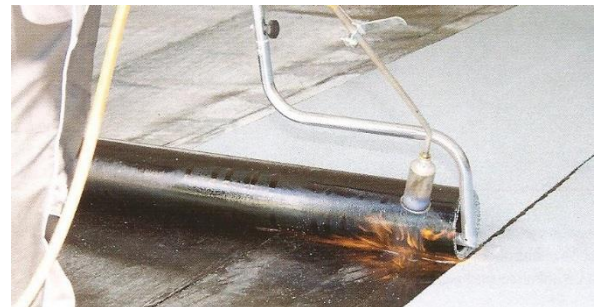
Variantní natavování rozbalovačem rolí