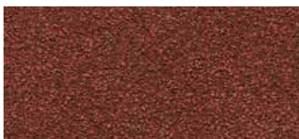
52 Bauxitově červená (ker. granulát)

Všechny vrchní posypy asfaltových pásů výrobního závodu BMI Siplast, Francie, jsou hydrofobizované (nenasákavé).