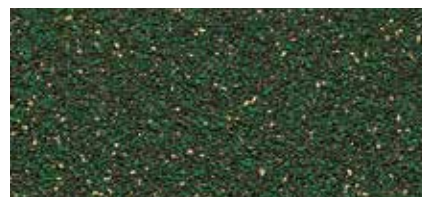
64 Světle zelená (keramický granulát)