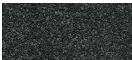
30 Tmavě šedá (minerální břídlíce)