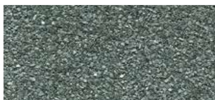
1 Světle šedá (minerální břídlíce)