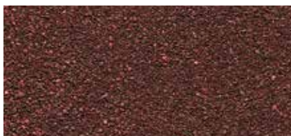
46 Hnědá (keramický granulát)