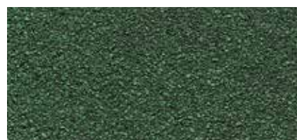
53 Malachitově zelená (ker. granulát)