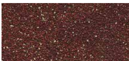
45 Cihlově červená (ker. granulát)