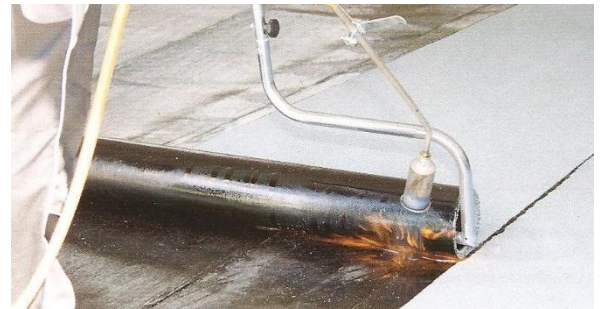
Variantní natavování rozbalovačem rolí