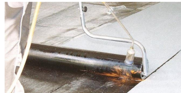
Variantní natavování s rozbalovačem rolí