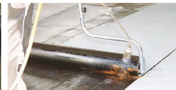
Variantní natavování s rozbalovačem rolí