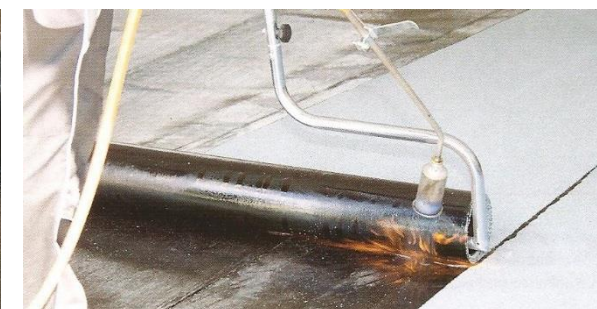
Variantsní natavování s rozbalovačem rolí